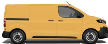
Gold-Gelb, RAL 1004 EOBS 800,00 (952,00)