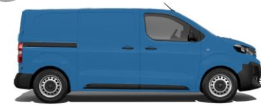
KML-Blau E03L 800,00 (952,00)