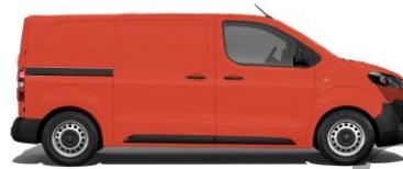
Post-Rot GB E01W 800,00 (952,00)