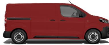
Ardent-Rot EOX9 800,00 (952,00)