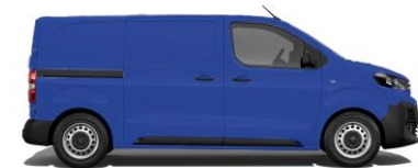
EDF-Blau 1987 E0MG 800,00 (952,00)