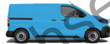
Post Nord-Blau EOCT 800,00 (952,00)