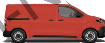
Feuer-Rot, RAL 3000 EOJH 800,00 (952,00)