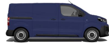
Imperial-Blau EO4P 800,00 (952,00)