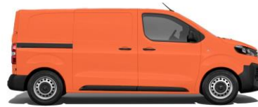
Kommunalorange, RAL 2011 EOHS 800,00 (952,00)