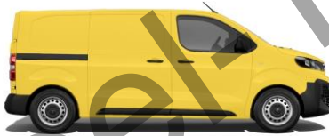
Verkehrsgelb, RAL 1023 EOA4 800,00 (952,00)