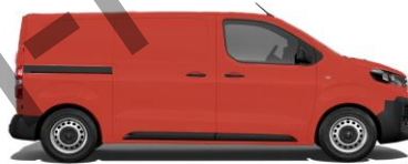
Feuer-Rot, RAL 3000 E0JH 800,00 (952,00)