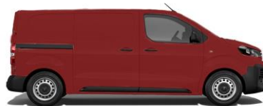
Ardent-Rot E0X9 800,00 (952,00)