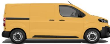
Gold-Gelb, RAL 1004 E0BS 800,00 (952,00)