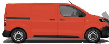
Post-Rot GB E01W 800,00 (952,00)