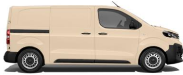
Hellelfenbein, RAL 1015 E0CC 800,00 (952,00)