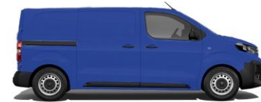
EDF-Blau 1987 E0MG 800,00 (952,00)