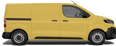
Ginster-Gelb, RAL 1032 E0AS 800,00 (952,00)