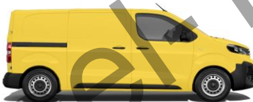
Verkehrsgelb, RAL 1023 E04A 800,00 (952,00)