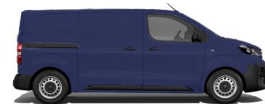
Imperial-Blau E04P 800,00 (952,00)