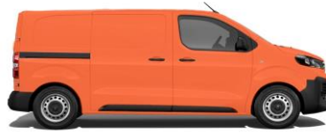
Kommunalorange, RAL 2011 E0HS 800,00 (952,00)