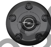
RADNABENABDECKUNG ZHYV, ZHYW, ZHZQ Serie