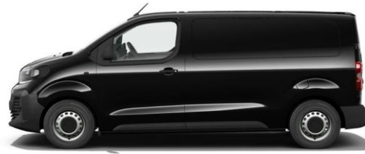
KARBON-SCHWARZ M09V 600,00 (714,00) nicht i.V.m. SPORTIVE