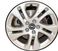
17-ZOLL-LEICHTMETALLFELGE ZHZZ 650,00 (773,50)