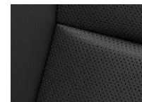
LEDER CLAUDIA CYFX Paket Luxury