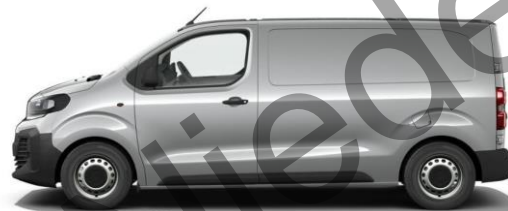
KONTRAST-GRAU M0F4 600,00 (714,00)