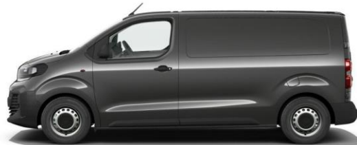
MERKUR-GRAU M01J 600,00 (714,00)