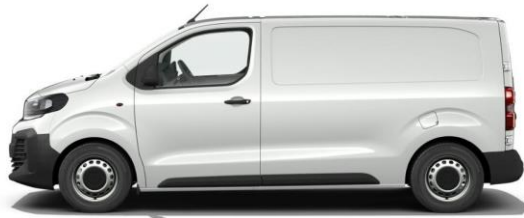
KAOLIN-WEISS POPR 0,00 (0,00)