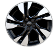
17-ZOLL-LEICHTMETALLFELGE ZHZN Serie i.V.m. SPORTIVE