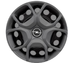
17-ZOLL-RADZIERBLENDE ZHYY Serie i.V.m. PDxx