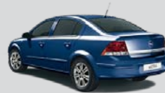
▲ Ultrablau 3