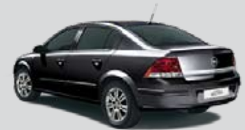
▲ Saphirschwarz 3