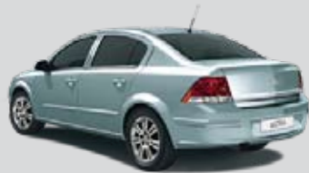
▲ Eisbergblau 3