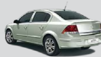
▲ Green Spirit 2