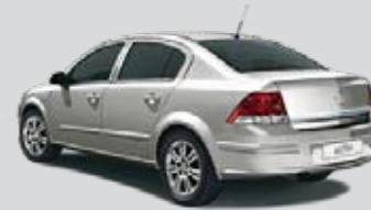
▲ Argonsilber 2