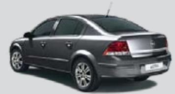
▲ Karbongrau 2