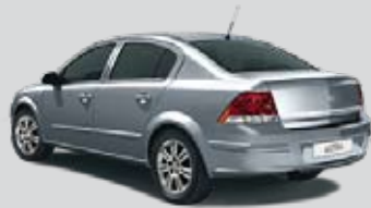
▲ Lichtsilber 2