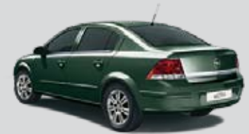
▲ Seegrasgrün 3