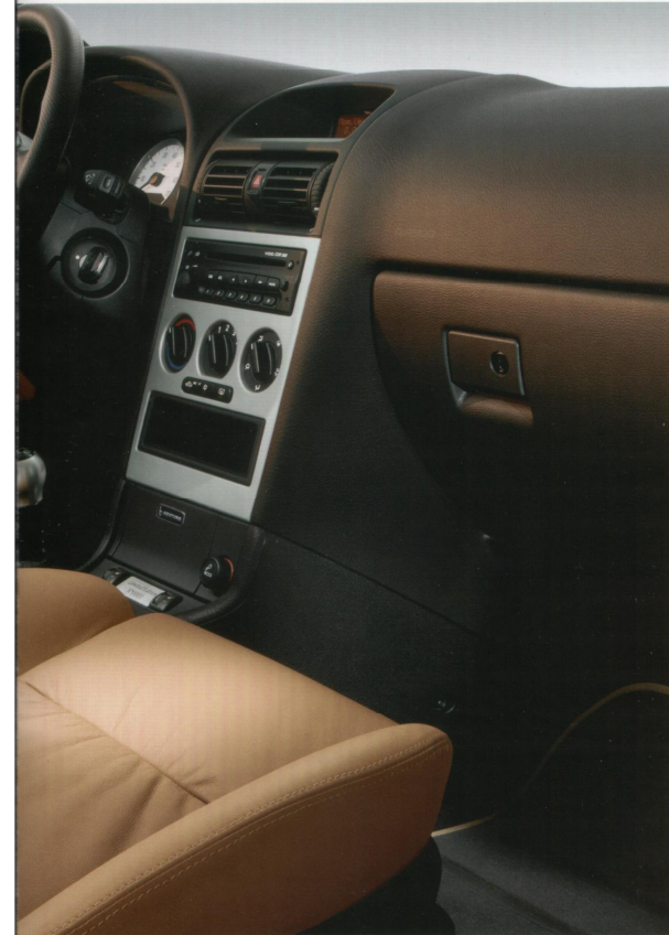
Luxuriöse Atmosphäre: Beheizbare Sportsitze (vorn) und Türinnenverkleidungen in kaschmirbeigem Leder, Schaltknäufel im Aluminium-Design und Sportlenkrad in schwarzem Leder, das ganze Innenleben spiegelt Dynamik und Eleganz wider.