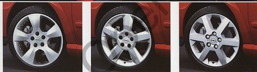
Leichtmetallräder im Format 71 x 17 im flachbündigen 5-Speichen-Design (Abb. ganz links) mit Reifen 215/40 R17 betonen die Dynamik des Linea Rosso 1.8 und 2.2. Der 2.0 Turbo bekommt Räder der Größe 71½ x 17 im 5-Speichen-Design (Abb. Mitte links), der 2.2 DTI erhält 4-Speichen-Leichtmetallräder der Größe 61 x 16 mit Reifen 205/50 R16.

Xenon-Scheinwerfer mit Hochdruck-Reinigungsanlage und automatischer Leuchtweitenregulierung bieten Ihnen in allen Situationen freie Sicht (serienmäßig bei 2.0 Turbo, sonst optional).