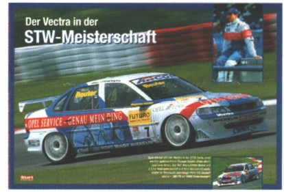
Poster Der STW-Vectra

56 Schall und Rauch Vor 70 Jahren raste Fritz von Opel mit dem Raketenauto Rak 2 über 200 km/h schnell über die Avus. Solche Versuche sollten ein erster Schritt sein zur Entwicklung von Luftfahrzeugen mit Raketenantrieb und zur Eroberung des Weltalls. Doch dieser Weg war eine Sackgasse. Geblieben ist die Erinnerung an mutige Männer in verrückten Fahrzeugen.