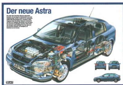
Poster Technik des Astra

14 Jetzt geht's los Am 20. März startet der neue Astra. Seine herausragenden Merkmale sind die vollverzinkte und stabile Karosserie, sparsame und Spaß machende Motoren und ein markantes Design. Sieben Motoren stehen zur Wahl, fünf Benziner und zwei Diesel. Zunächst kommt der Astra als Drei- und Fünftürer und als geräumiger Caravan.