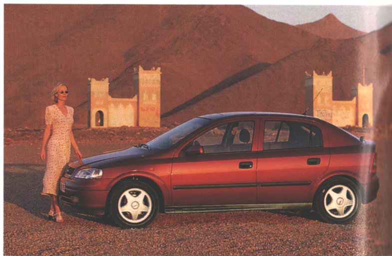
Mit neuem Design, neuer Fahrwerkstechnik und sieben Motoren, allesamt Vierventiler, kommt der Astra im Frühjahr '98 auf den Markt (Seite 24)

Der Astra feiert Weltpremiere auf der IAA in Frankfurt. Von Kopf bis Fuß ist alles neu: Karosserie (jetzt vollverzinkt), DSA-Sicherheitsfahrwerk und drei neue Motoren. Dazu jede