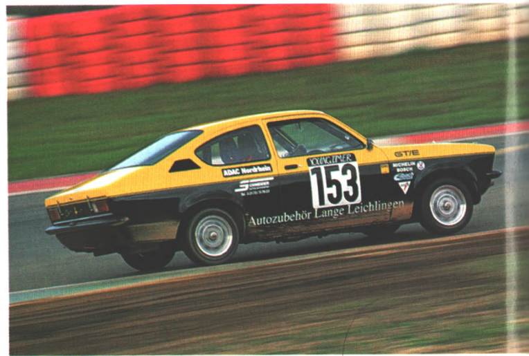
Sportler reaktiviert: Youngtimer, wie dieses Kadett Coupé, haben ihre eigene Bühne, auf der sich Autos der sechziger und siebziger Jahre messen (Seite 62)