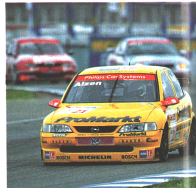
Lehrjahr eingeplant: Neu dabei im STW-Cup ist Opel mit dem Vectra (Seite 94)