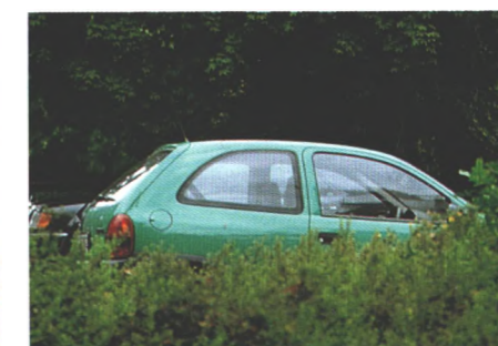
Prima erkennen kann man den Corsa in der Farbe Mintgrün, weil sie auch bei Schmuttelwetter auffällig ist. Ein nicht zu unterschätzender Sicherheitsfaktor (Seite 48)