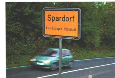
Prima Benzin sparen kann der Corsa Eco 3. Mit dem Prototyp ging Start auf Tour, um zu testen, wie sich so ein „Drei-Liter-Auto“ in der Praxis fährt (Seite 28)