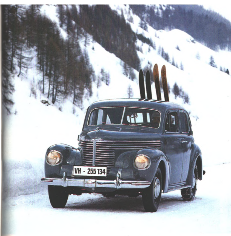
Prima Laune macht eine Winterreise in einem alten Kapitän von 1939 und die anschließende Ski-Abfahrt im Stil unserer Großväter (Seite 72)