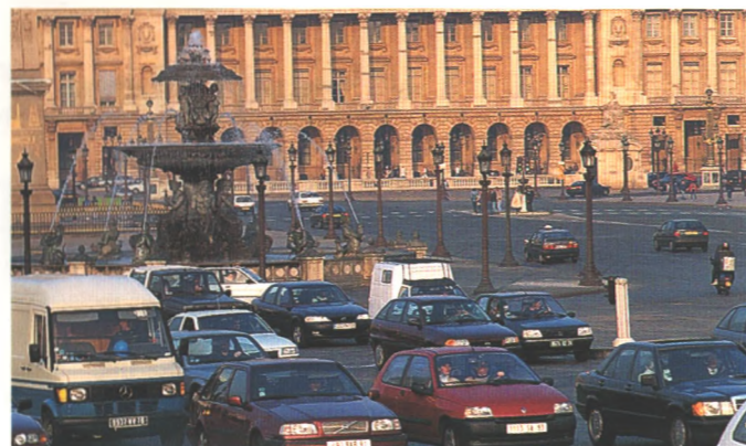
Prima zurecht kommt man im dichten Pariser Verkehr mit der neuen Vectra-Automatik und einem Navigationssystem (Seite 14)

Geringer Wartungsaufwand, niedrige Reparaturkosten und eine günstige Kasko-Einstufung machen den neuen Vectra auch nach dem Kauf zu einem preiswerten Auto.