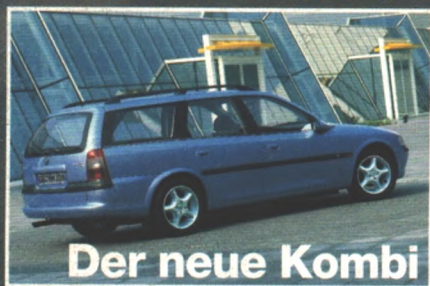
Der neue Kombi