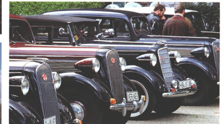
Edle Oldies trafen sich bei einem großen Stelldichein der Opel Super 6 (Seite 86)