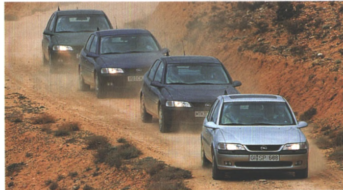
Harte Prüfungen gehören dazu, wenn Ingenieure Fahrwerke entwickeln. Auch der Vectra wurde nicht geschont (Seite 34)

Das Multi-Ram-System hält jetzt, in verbesserter Form, auch im neuen Vectra Einzug. Start sagt, wie's funktioniert und was der Fahrer davon hat.