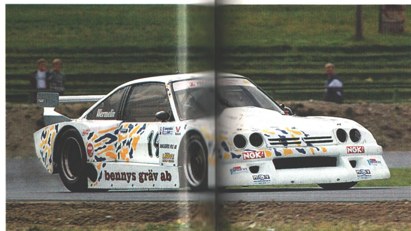
Fast zwei Meter breit und mit mächtigen Flügeln und Spoilern bewaffnet, machte sich ein Manta in Schweden daran, die Konkurrenz bei den Spezial-Tourenwagen zu vernaschen. (Seite 88)