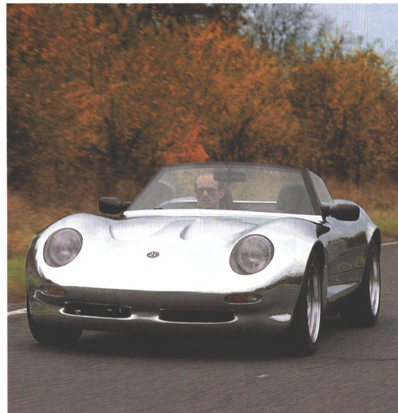
Fast 40 Jahre lang baute Caterham nur einen Sportwagen – den Super Seven, einen klassischen Roadster mit freistehenden Rädern. Jetzt hat die kleine aber feine britische Firma einen weiteren offenen Sportwagen mit Aluminium-Karosserie und Opel-Motor im Programm, den Caterham 21. (Seite 70)