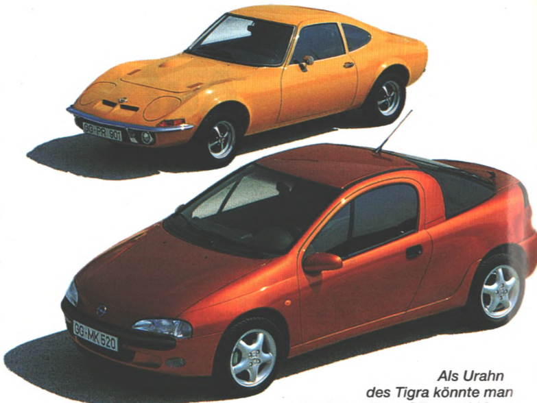
Als Urahn des Tigrä könnte man den legendären GT von 1968 einstufen. Auch er gehört zur weitläufigen Coupé-Familie von Opel, deren Nachkriegsgeschichte 1961 mit dem Rekord P2 begann. Seite 34.

Bei der Gestaltung des Tigrä konnten die Designer ihrer Kreativität freien Lauf lassen, denn das Coupé ist von Grund auf neu und mußte sich nicht an der Form eines Vorgängers orientieren.