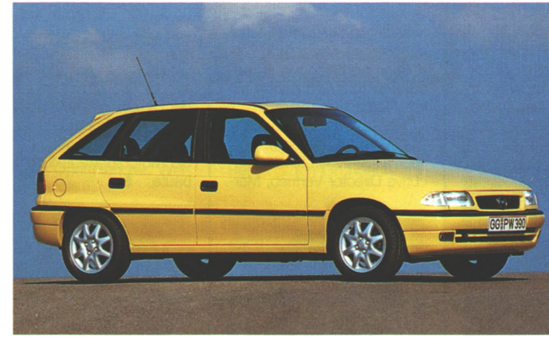
Als Sprinter bekannt ist der Astra GSi 16V, der jetzt optisch retuschiert wurde. Daneben gibt es noch zahlreiche weitere Änderungen vom Opel-Modelljahrgang '95 zu vermelden. Seite 48.