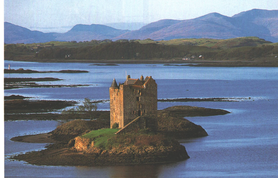
Als Land der tiefen Lochs und weiten Highlands gilt Schottland. Auch trutzige Burgen, das Foto zeigt Stalker Castle an der Westküste, gehören zum Bild des rauen Landes, durch das die Reisereportage führt. Seite 78.