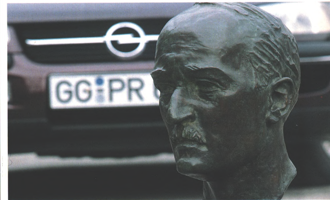
Rudolf Diesel erfand vor über 100 Jahren den Dieselmotor. Auch der moderne Omega TD mit 130 PS arbeitet im Grund nach dem von ihm entwickelten Prinzip. Wie es entstand, was dahintersteckt und wer der Mensch Rudolf Diesel war, das alles ist eine spannende Geschichte über einen genialen Erfinder. Seite 14.