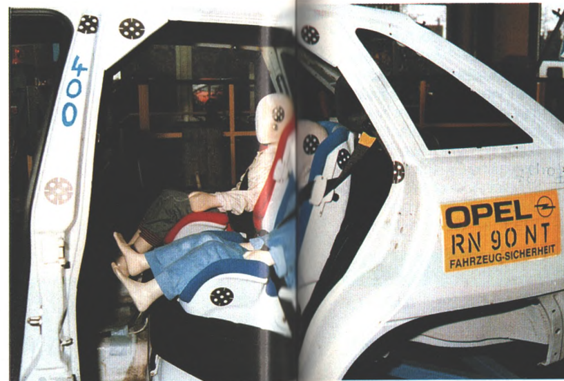
Kinder, die im Auto mitfahren, gehören in einen speziellen Sitz, der auf ihr Alter und ihre Größe zugeschnitten ist. Opel-Sicherheitsexperten entwickelten jetzt ein variables System, das vom Babyalter an „mitwächst“. Seite 44.