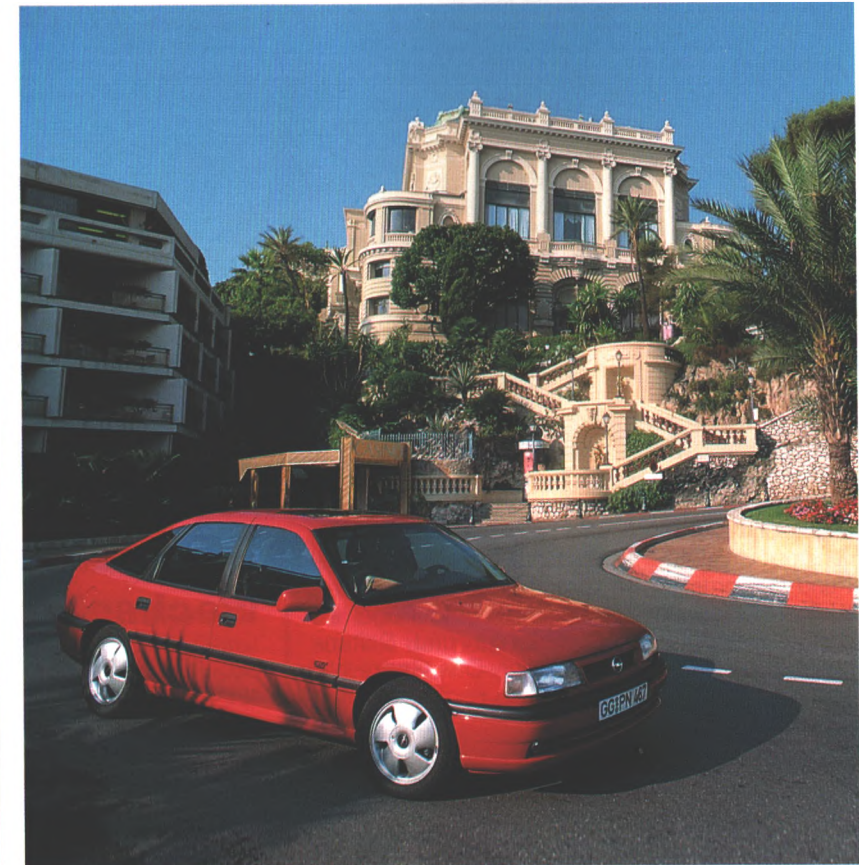
Monte Carlo ist jedes Jahr im Januar Ziel des ersten Laufes zur Rallye-Weltmeisterschaft. Legendar vor allem die Wertungsprüfung „Nacht der langen Messer“. Ein Start-Team folgte den Spuren der „Monte“, allerdings stand jetzt Rasen im Vordergrund. Seite 70.

Geschichten von anno dazumal rund ums Auto