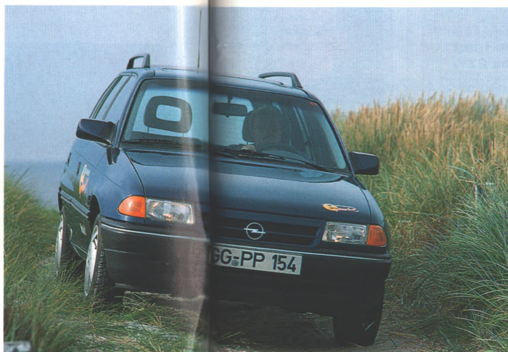
Leise und abgasfrei ist der Impuls 3, ein Elektroauto auf Basis des Caravan, der im Rahmen eines Großversuchs auf Rügen läuft. Start befragte die Benutzer nach ihren Erfahrungen. Seite 64