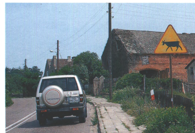
Reizvoll und abenteuerlich ist eine Reise nach Kaliningrad, dem ehemaligen ostpreussischen Königsberg. Start machte sich mit dem Monterey auf den Weg. Seite 100

130 Damals Geschichten von anno dazumal rund ums Auto