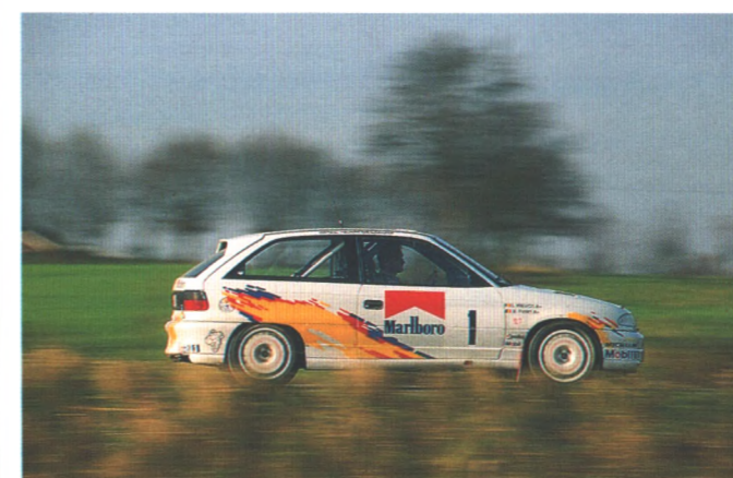
Aufregend und spektakulär ist eine Fahrt mit dem Rallye-Astra des belgischen Weltmeisters Bruno Thiry. Start durfte sich hinter Steuer setzen. Seite 118