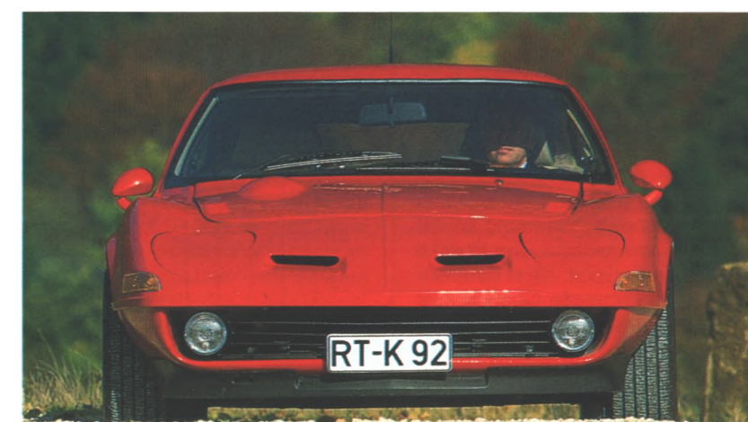
Schön und schnell ist ein neuer Sportwagen, unter dessen Karosserie im GT-Look moderne Opel-Technik steckt. Start stellt den Eigenbau vor. Seite 78