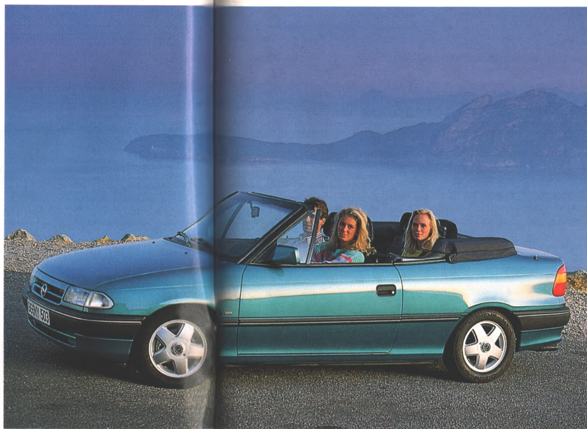
72 Mit voll versenkbarem Verdeck und ohne Bügel kommt das Astra Cabrio ab Mai auf den Markt