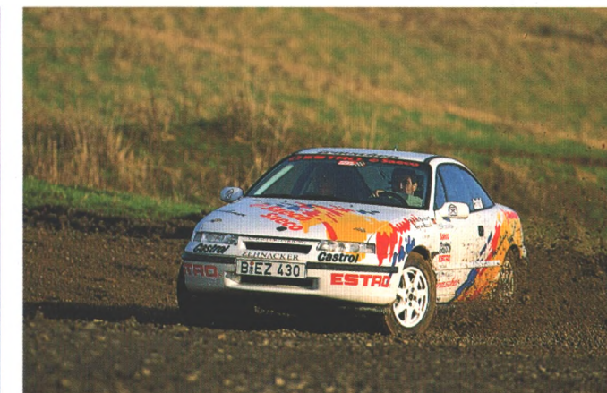
116 Mit einem Rallye-Calibra Turbo Gruppe N, den ein englischer Opel-Händler aufbaute, möchte ein deutscher Privatfahrer in der Meisterschaft mitmischen