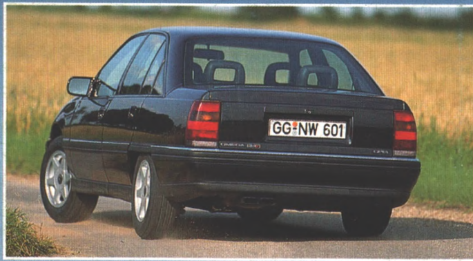
Omega 24 V