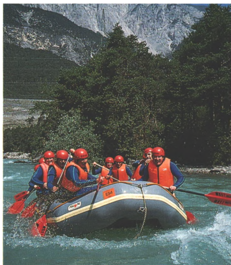
Spannend und anstrengend ist Rafting, ein Kampf mit den Naturgewalten (Seite 76)