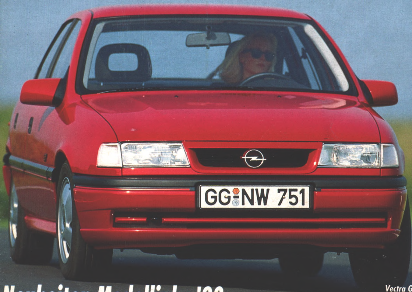
Vectra GT 16V