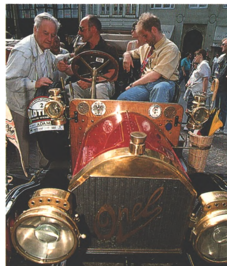
Schön und wertvoll ist der Opel Doppel-Phaeton von 1908, einer von über 180 Veteranen, die bei der Oldtimer-Rallye in Wiesbaden starteten (Seite 70)