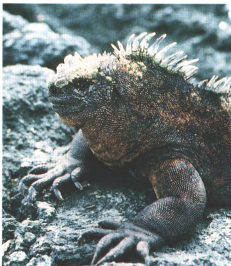
Neue Arten entwickelten sich über Jahrhunderte auf Galapagos im Pazifik. Viele sind in Gefahr (Seite 66)