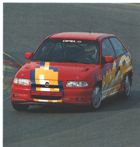
Neue Akzente in der Gruppe N will der Astra setzen. Mit vier Markenkollegen trat er für start am Nürburgring an (Seite 86)