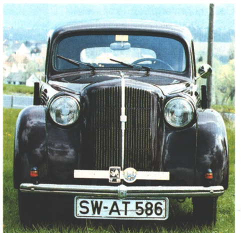
Erfolge begleiteten den Kadett auf seinem langen Weg vom ersten Auftritt 1936 bis zu seiner Ablösung durch den Astra 1991 (Seite 94)