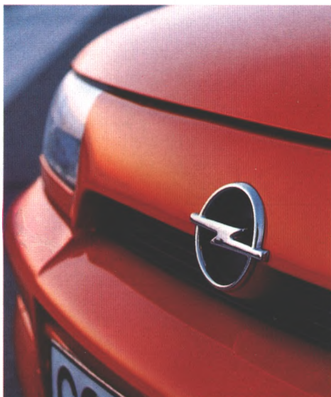
Ergebnisse der Design-Arbeit finden sich auch in vielen Details der Astra-Karosserie (Seite 62)

■ Väter des Astra; Menschen, die maßgeblich seine Entwicklung bestimmten 90