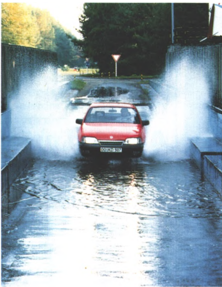
Im Wasserbad wird geprüft, ob alles dicht bleibt. Einer von vielen Tests, die alle Modelle in Dudenhofen bestehen müssen (Seite 38)

Erst eine neue Technik macht die extrem niedrigen Scheinwerfer des Calibra möglich. Wie sie funktionieren und welche Weiterentwicklungen möglich sind, sagt der Bericht