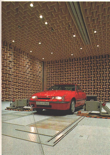
Groß wie eine Turnhalle ist das neue Schall-Labor von Opel für die Akustik-Forschung (Seite 26)

Mit einem Vectra 2.0i 4x4 war ein Autotester auf großer Tour über 55 Alpenpässe