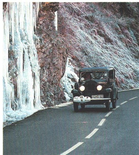
Flott wie früher zeigte sich der Opel 1,2 Liter von 1932 bei einer Veteranen-Rallye durch die Alpen (Seite 54)

Aus Anlaß des 150jährigen Jubiläums der Fotografie lichteten bekannte Fotografen den Calibra aus ihrem ganz persönlichen Blickwinkel ab