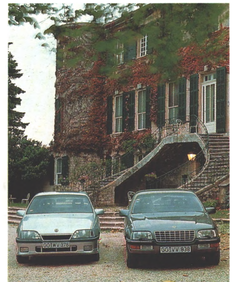
Schmackhaft wie die französische Küche ist eine Reise durch die Provence mit Omega 3000 und Senator (Seite 60)