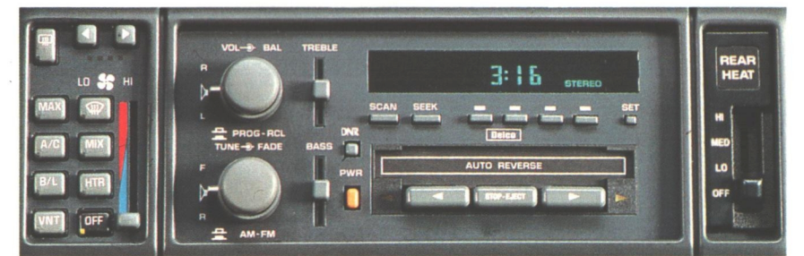
Für Unterhaltung sorgt das UKW/MW-Stereoradio mit Autoreverse-Cassettenrecorder und Digitaluhr.