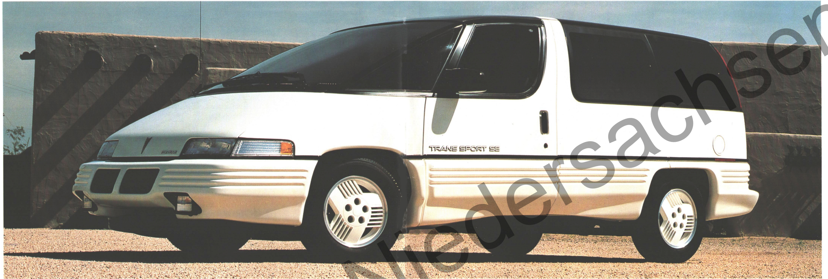
Trans Sport owners can arrive fashionably at the most exclusive social gatherings. Die Besitzer des Trans Sport kommen zu allen gesellschaftlichen Anlässen im angemessenen Fahrzeug.

The APV (All Purpose Vehicle) finally comes of age, thanks to Pontiac's new Trans Sport, a space vehicle for the 90's. A sleek, unique shape that blends perfectly with brightly colored body panels and tinted glass. High-fashion overtones that would not be out of place at a country estate or parked in front of five-star restaurant.