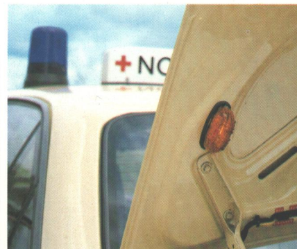
Rechts unten: Zusätzliche Blinkleuchte an der Gepäckraumklappe mit Ein/Aus-Schalter. Links: Für den nachträglichen Einbau des Funkgerätes und die Bedienelemente der Warneinrichtungen an griffgünstiger Stelle ist eine spezielle Konsole erhältlich.

spiegel • Scheinwerfer Wisch/Wasch-Anlage • ABS • Sperrdifferential • Allwetterreifen • Ölwanenschutz • Niveauregulierung • Ladeschlitten (bei Caravan) • 2 Blinkleuchten auf dem Dach, hinten •