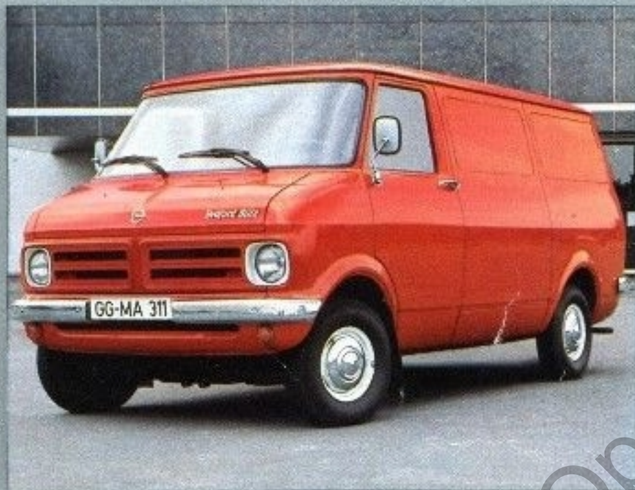
Bedford Blitz Transporter als Kastenwagen

Transporter sind vielseitig, leistungsstark, wirtschaftlich und langlebig. Robuste, bewährte Konstruktion, große, ebene Ladefläche. Als Kasten-, Pritschen- oder Kombiwagen. Fahrgestell mit Fahrerhaus ideal für die verschiedensten Sonderaufbauten. 2 Radstände, zul. Gesamtgewicht: 2.340-3.500 kg je nach Modell. Benzin- und Dieselmotoren.