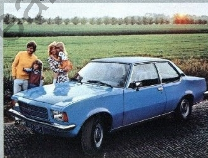
Rekord, 2-türig, Luxus