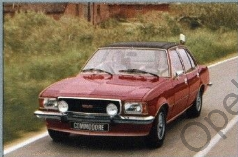
Commodore GS/E, 4-türig