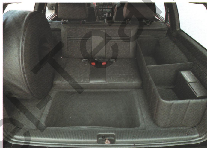
Kindersitzbank im Fahrzeugfond (Sonderausstattung)

Komfortsitze mit elektrischer Neigungs-, Höhen- und Lehneinstellung, Heizung und Memory-Schaltung in Wasserbüffelleder-Stoff-Kombination sowie dazu passende Türtafeleinsätze sorgen für ein exklusives Ambiente. Hochglanzpoliertes Nußbaum-Wurzelholz mit lebendiger Maserung