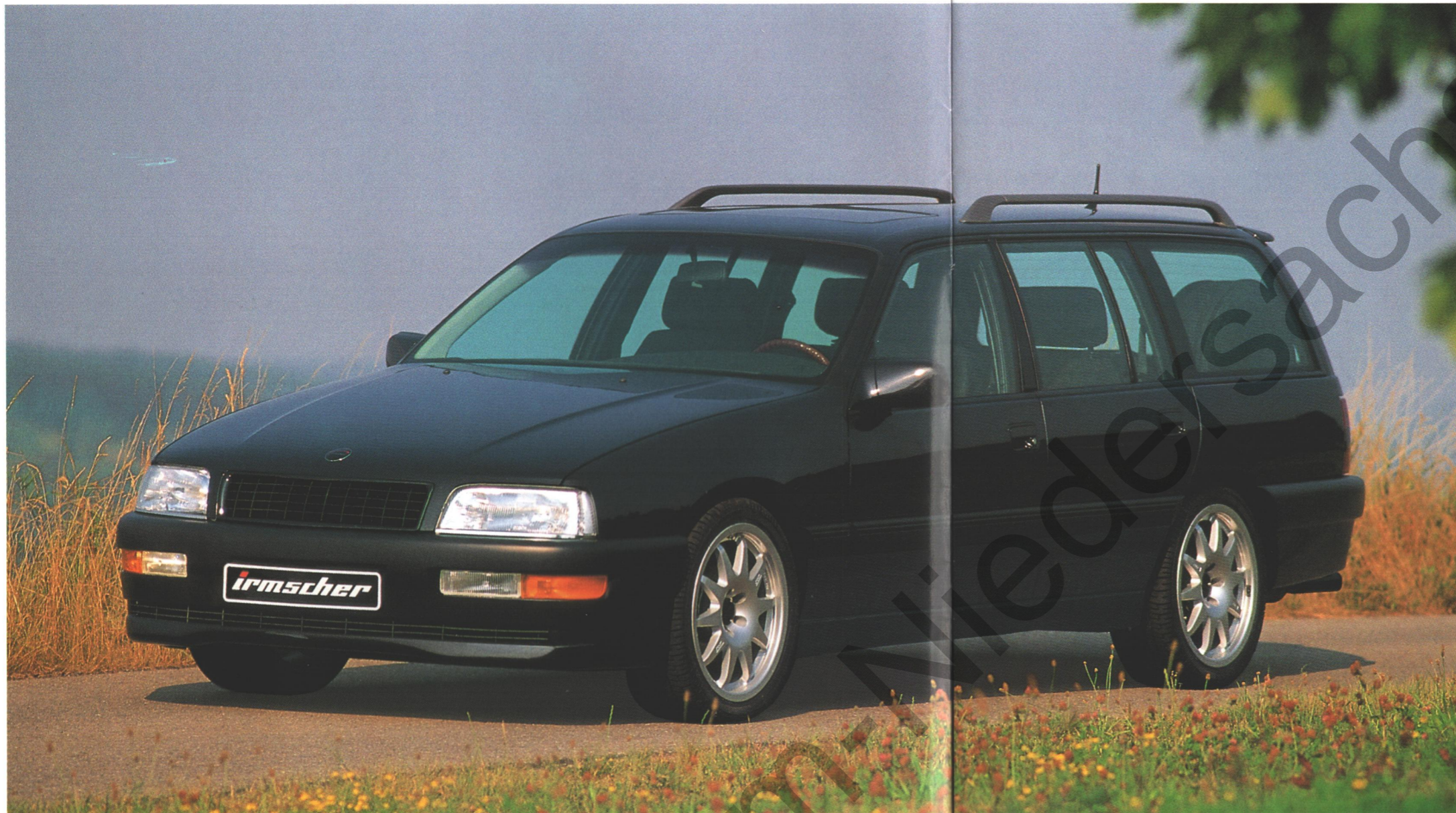
Irmischer C30E und C40E mit Sonderausstattung (LM-Räder im Speichen-Renn-Design OF-07)