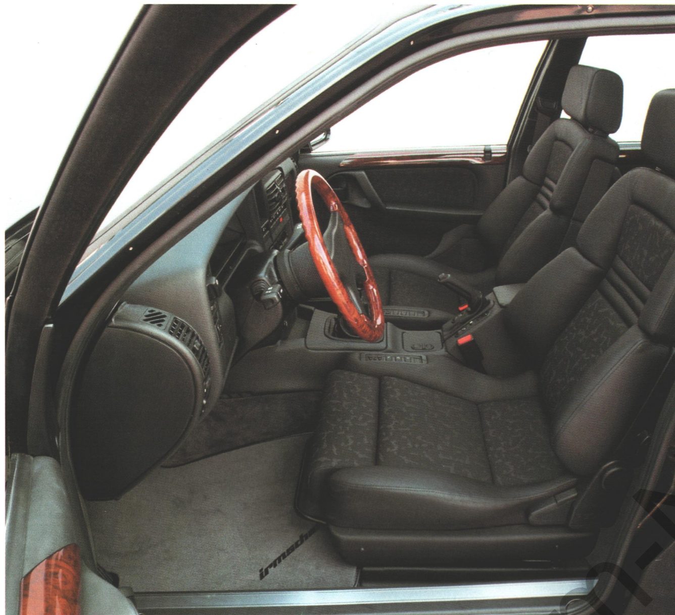
Luxuriöse Innenausstattung mit Komfortsitzen in Leder-Stoff-Kombination, speziellen Türtafeleinsätzen bei den Modellen Irmscher C30E und C40E

Der Innenraum der Irmscher Caravan Modelle C30E und C40E signalisiert Lebensstil und Exklusivität. Die edlen Materialien werden von spezialisierten Handwerkern mit größter Sorgfalt verarbeitet: