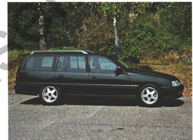
Irmischer C40 mit Sonderausstattung (Dachspoiler OK-13)

Die Modelle Irmischer C30E und C40E bestehen durch elegantes Karosserie-Design und nobles Interieur. Modernstes Styling, das sich harmonisch in die Irmischer Modellreihe einfügt, verleiht diesen Caravan-