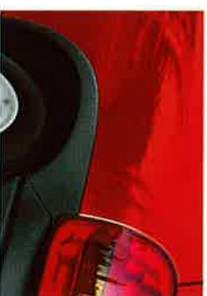
Magnarot, gegen Mehrpreis