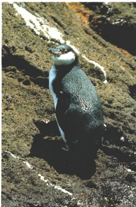
Meister-Schwimmer: Eine Opel-Aktion hilft, den gefährdeten Galapagos-Pinguin zu schützen (Seite 60)

Mit vielen neuen Modellen, die zum Teil auch in Deutschland angeboten werden, startet General Motors ins Jahr 1990