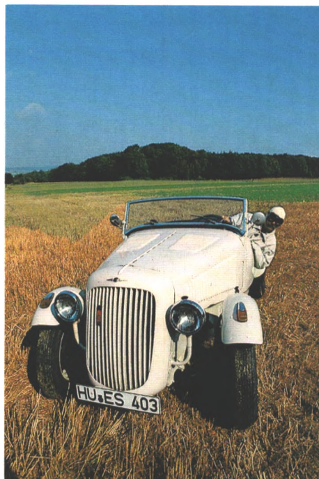
Gelände-Sportler: Der Opel Super 6 kämpfte sich vor 50 Jahren über Stock und Stein (Seite 48)