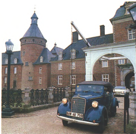
Traum-Reise: Mit zwei Cabrios von Schloß zu Schloß am Niederrhein (Seite 52)

Der Schriftsteller Wolfdietrich Schnurre philosophiert über Verkehrszeichen aus aller Welt