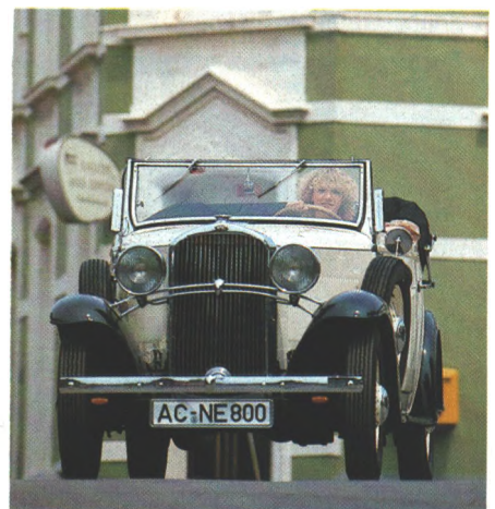
Solo: Perfekte Restauration machte dieses schöne Opel-Cabriolet zu einem wertvollen Einzelstück

Als erster Mensch zischte vor fast 60 Jahren Fritz von Opel mit einem Raketenflugzeug durch die Luft