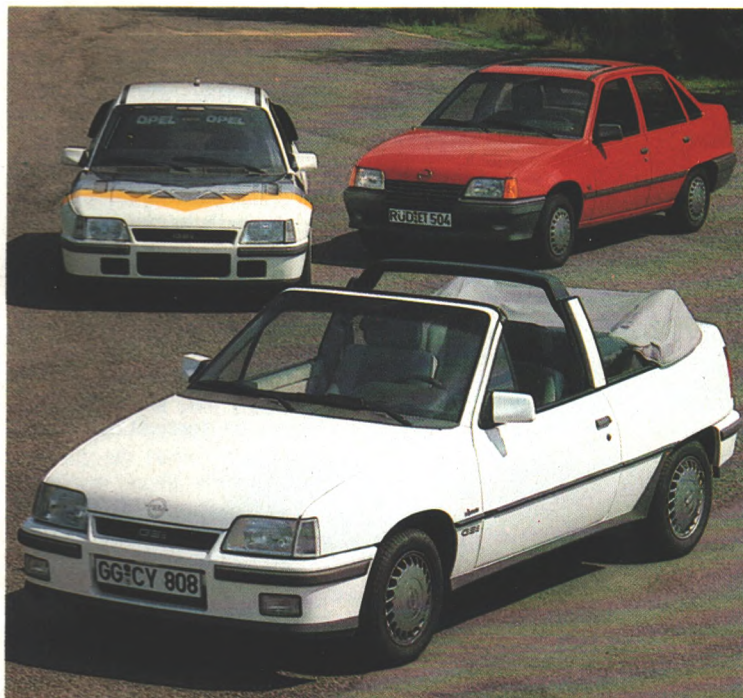
Trio: Die Kadett-Familie wird immer größer. Zu den bekannten Versionen kommen jetzt noch ein Stufenheck-Modell, ein Cabrio und ein Allrad-Flitzer

Für den Sparteinsatz entwickelte Opel auf Basis des Kadett GSi einen Allrad-Renner, der das Zeug dazu hat, der Konkurrenz mächtig einzuheizen