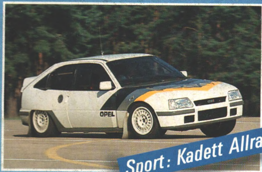
Sport: Kadett Allrad