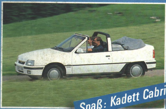
Spaß: Kadett Cabrio