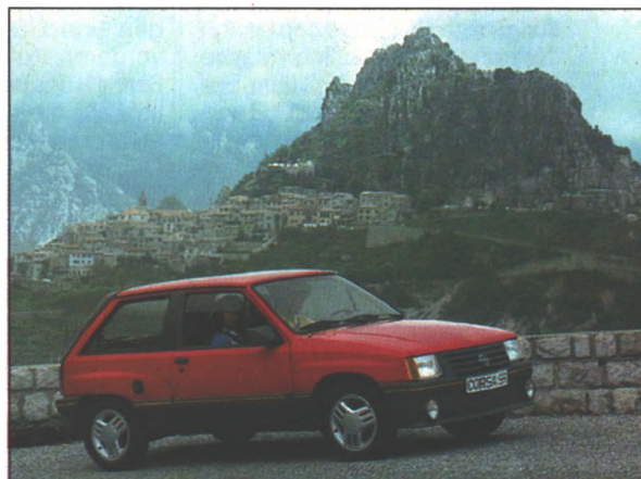
Gipfelsturm: Corsa SR auf Monte-Kurs