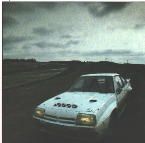
Rundenrekord: Die erste Bestzeit